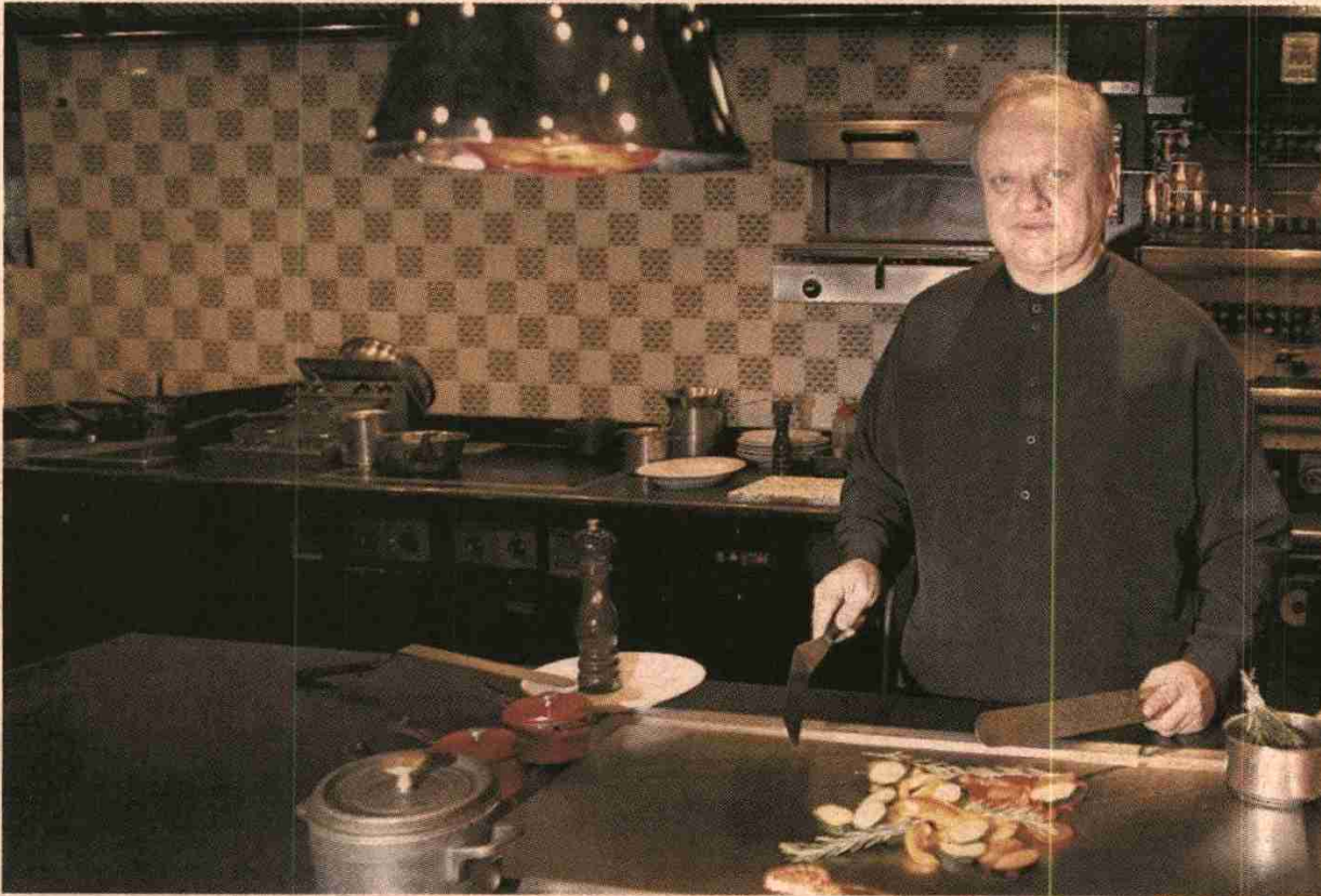
Joël Robuchon, el pasado día 29 en el restaurante Yoshi de cocina kaiseki (alta gastronomía japonesa), sito en